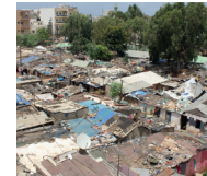
Ganzheitliche, nachhaltige Slum-Transformation