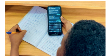
Lern-App und KI-Chatbot, 5fach Global Award preisgekrönt