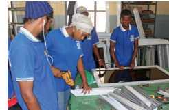
Qualifizierung & Einkommen