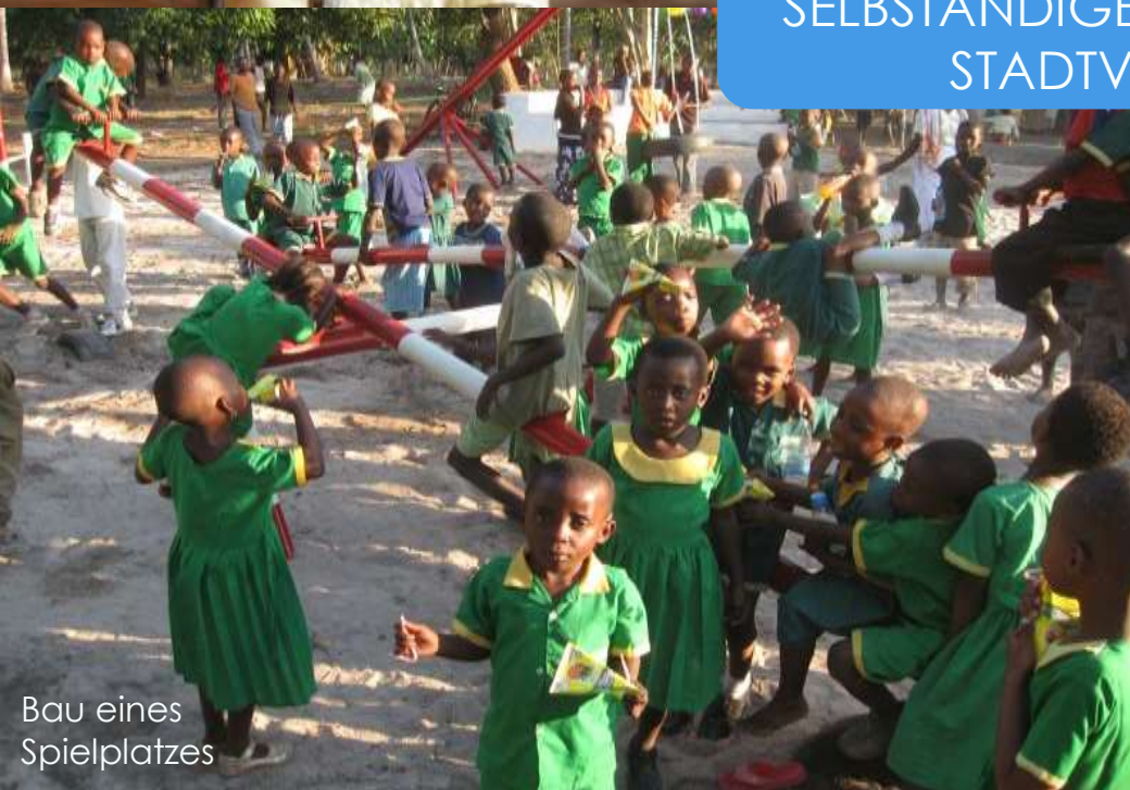
Bau eines Spielplatzes