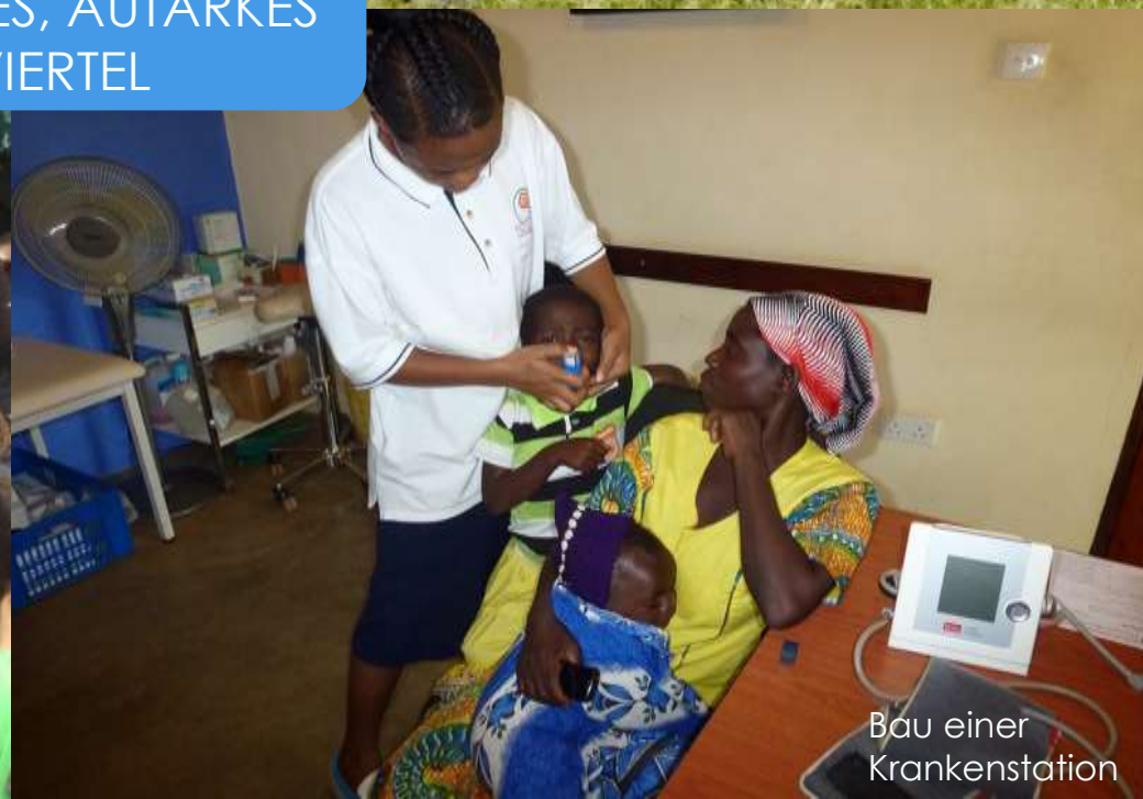
Bau einer Krankenstation